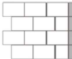
2 Wanduiteinde met staande voeg