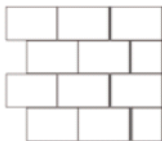
1 Vrij wanduiteinde